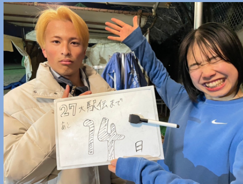
27大駅伝カウントダウン